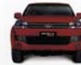
ROJO DE LA ROSA